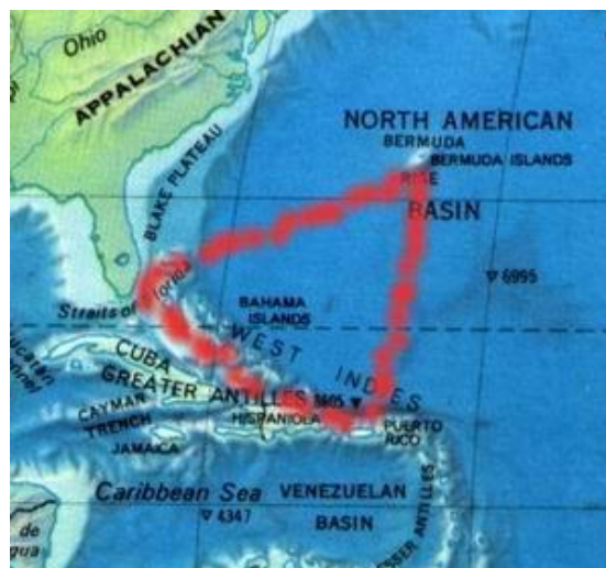
TRIÁNGULO DE LAS BERMUDAS