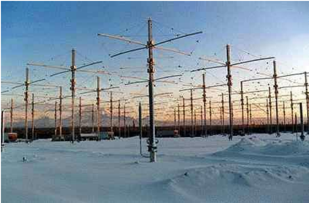
Complejo de antenas pertenecientes al programa HAARP