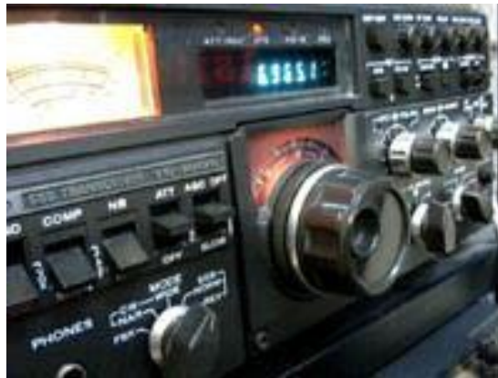
La cifra mágica 6.965 Mhz. , en la pantalla del receptor