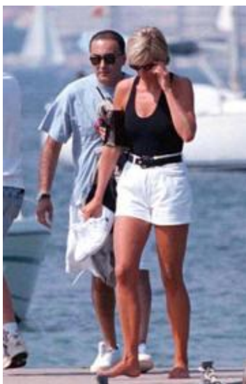
LADY DI Y DODI AL FAYED