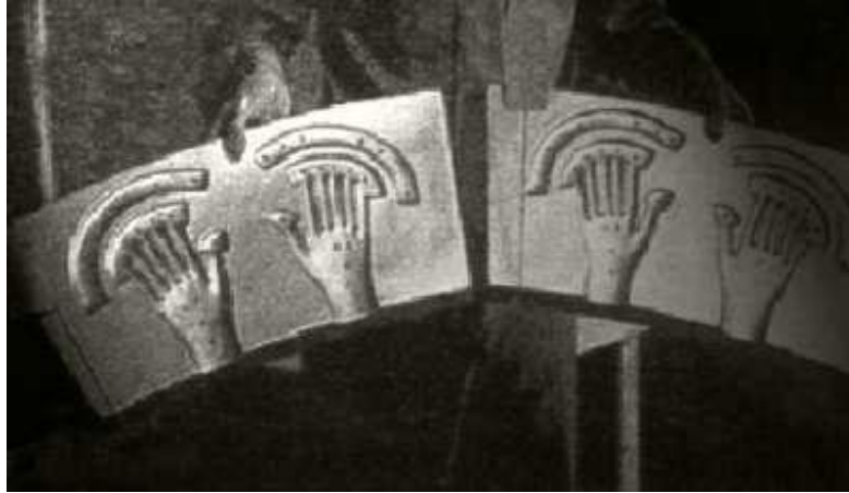
PLANCHAS DE LOS CONTROLES DE MANDO DEL OVNI ESTRELLADO