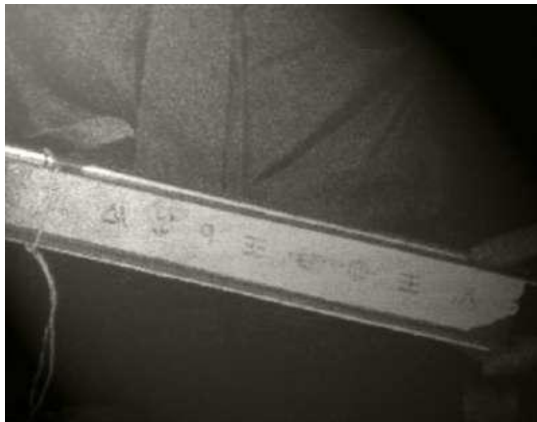
Objeto de metal con extraños jeroglíficos pertenecientes al Ovni estrellado en Roswell